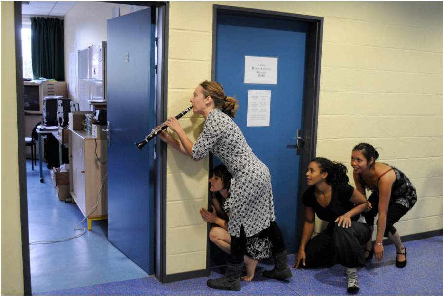
« Attentat poétique » collège Garcia Lorca, St-Denis (93)